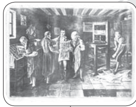
Pie de foto Taller primitivo de impresión: El cual muestra las diferentes personas que se encargaban del oficio de imprimir como el corrector, cajista y el impresor.

La Imprenta requería de tres operarios para realizar los trabajos de impresión: el corrector, el cajista y el impresor. En la imagen se encuentra Nariño examinando un pliego impreso de los Derechos del Hombre; tiene la mano puesta sobre el hombre de don Antonio Espinosa de los Monteros.